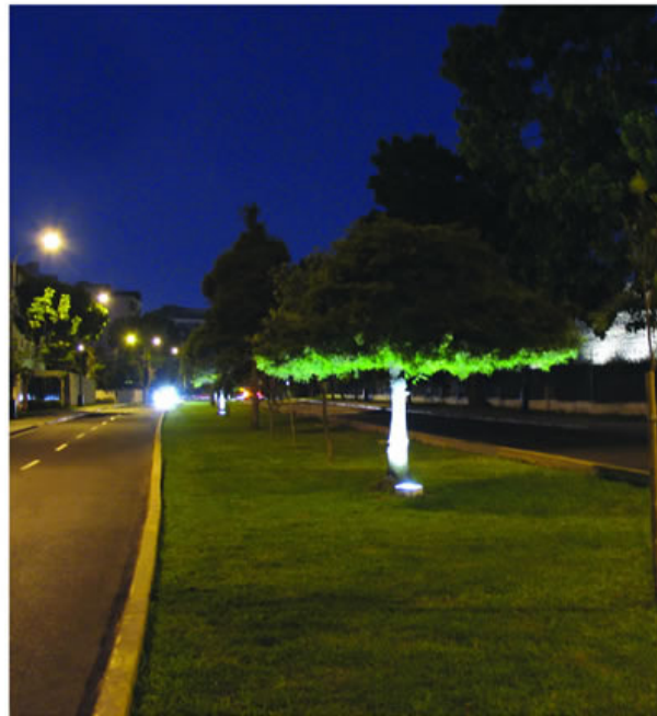
Gracias a un aporte vecinal, El Rosario luce nueva iluminación.

Respetando el deseo de estos generosos vecinos, sólo queda decir, en nombre de los sanisidrinós, mil gracias. ■