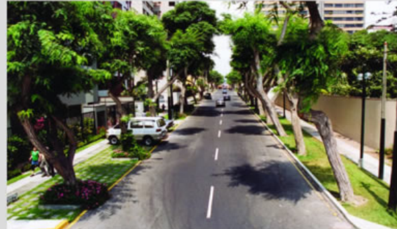
Av. Dos de Mayo, emblemática zona del sub sector 1-2.

¿Qué mejoras cree que ha habido en el subsector?