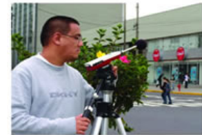
Mapa de ruidos molestos en proceso.

Este mapa, que será producto del monitoreo en 31 puntos distintos de San Isidro, permitirá identificar los lugares álgidos, donde la contaminación auditiva es mayor, con lo que se podrá efectuar una mejor toma de decisiones en la prevención y control de ruidos molestos. ■