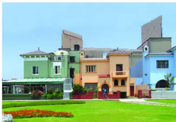
Nuevos colores para una zona tradicional.