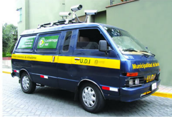
UDI: sancionando infractores.

Identificada la infracción y en cuestión de segundos, los equipos fotografían la placa del vehículo, para su posterior impresión y uso como prueba de la falta.