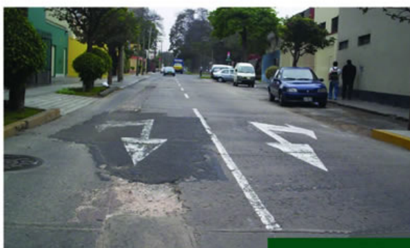
Ca. Federico Villareal cuadra 0