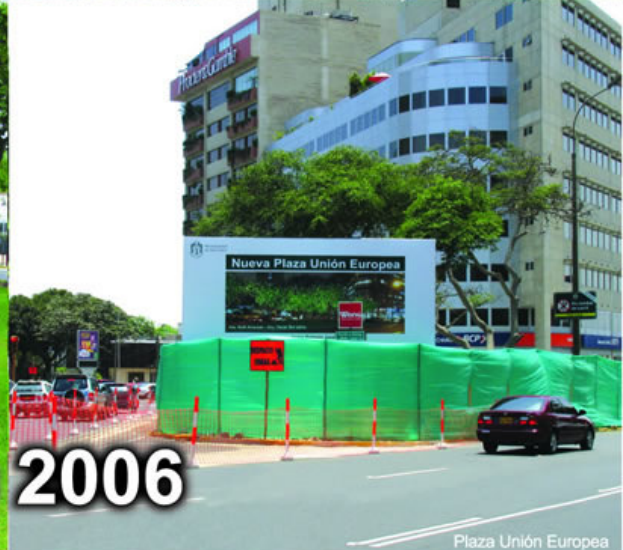
Plaza Unión Europea