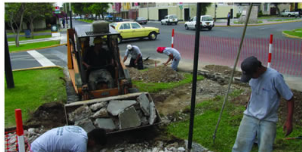
Avenida Alberto del Campo en proceso de recuperación.

La ejecución, que es realizada por la empresa Orión Contratistas Generales SRL, incluye el parchado, mantenimiento y recuperación de 6996.52 metros cuadrados de pistas y 1542.86 metros cuadrados de veredas y el pintado de la señalización vial respectiva. Se estima que los trabajos concluirán en 60 días. ■