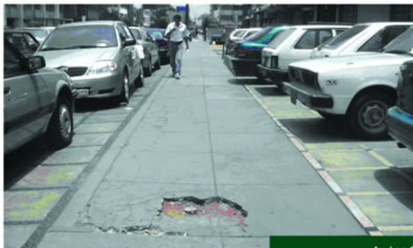
Av. Las Camelias cuadra 8