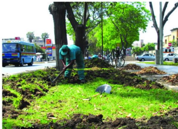
Recuperando una avenida histórica.

En una segunda fase, se tiene prevista la colocación de bancas, sin recortar la ciclovia y la instalación de luminarias ornamentales, especialmente en las cuadras próximas al Puente Villarán, donde se iluminarán las enormes palmeras que adornan la zona.