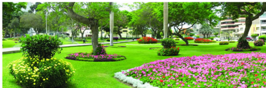
Parque Alfonso Ugarte uno de los ganadores.

trabajo en el mejoramiento de áreas verdes, estado fitosanitario de las plantas, limpieza y mantenimiento del césped, podas, mantenimiento de elementos urbanos y control de malezas, entre otros. ■