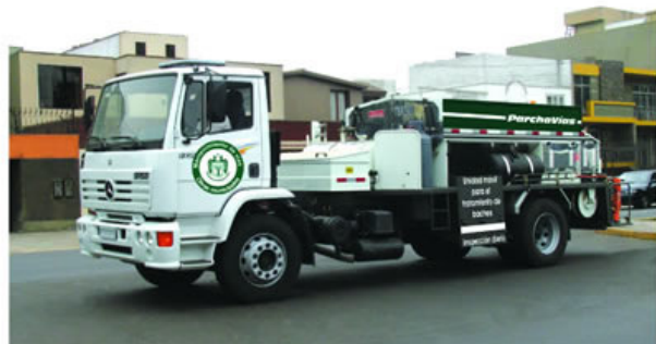
Tecnología de punta para el parchado de pistas y veredas.

significará un sustancial ahorro a la municipalidad y un aporte fundamental en la tarea de mantener en buen estado las calles del distrito. ■