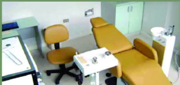
Consultorio odontológico a su servicio.

% de las personas que solicitan carné sanitario tienen algún problema de salud bucal, por lo que se vienen brindando además las recomendaciones necesarias a los concurrentes. ■