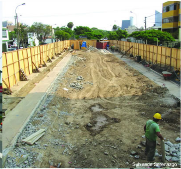
Sub sede Serenazgo