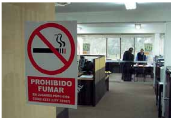
Señalización en las instalaciones municipales.

Este mal ha desencadenado cientos de campañas antitabaco en todo el mundo, y el Municipio de San Isidro también contribuye al respecto. Se ha publicado el Decreto de Alcaldía N° 015, en el que se declara a todos los locales municipales Ambientes Libres de Humo de Tabaco, quedando prohibido fumar en ellos, así como en los vehículos de la municipalidad. Con la medida se busca mejorar la salud y el ambiente laboral de los trabajadores y de los vecinos que acudan a las instalaciones ediles.