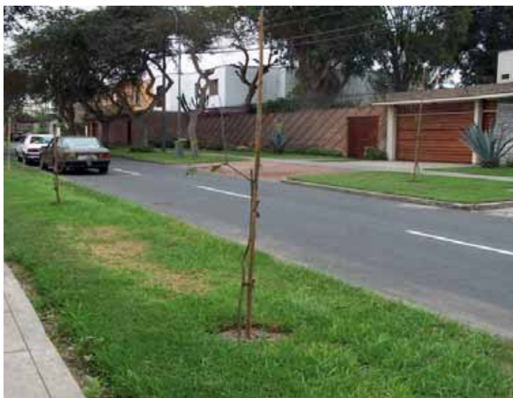
Calle Manuel Ugarte y Moscoso