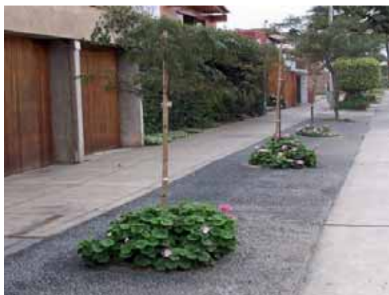
Calle Santa Teresita

La Gerencia de Obras y Servicios Municipales, viene desarrollando una activa campaña de sembrado en diferentes sectores, con la que se aspira a que el ornato siga de la mano con la ecología y la preservación ambiental.