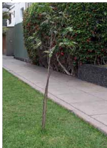
Calle Punta Negra