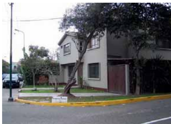
Buen ejemplo: iniciativa saludada por la Municipalidad

Por este motivo y en un claro ejemplo de civismo, los propietarios del predio ubicado en el cruce de la Av. Los Incas con la calle Tamayo, retiraron las rejas instaladas en su vivienda, mejorando de esta manera el entorno de El Olivar.