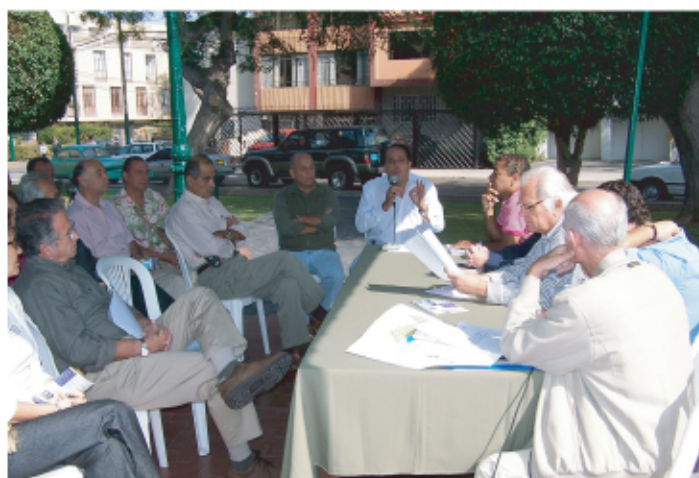
Las visitas de trabajo continuarán durante toda la gestión.

En esta primera oportunidad el sub sector visitado fue el 1 - 1. Reunidos en el Parque José Domingo García Rada, los vecinos