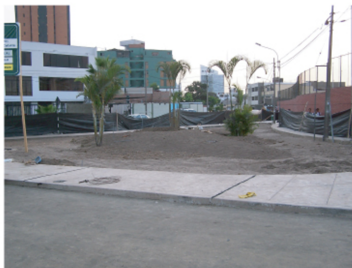
La obra permitirá una mejor circulación vial.

Esta obra permitirá que el flujo vehicular de la zona sea ordenado y seguro, sobre todo a la hora de salida e ingreso del alumnado del Colegio San Agustín. ■