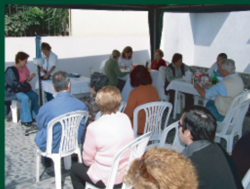
Parroquia San Felipe Apóstol