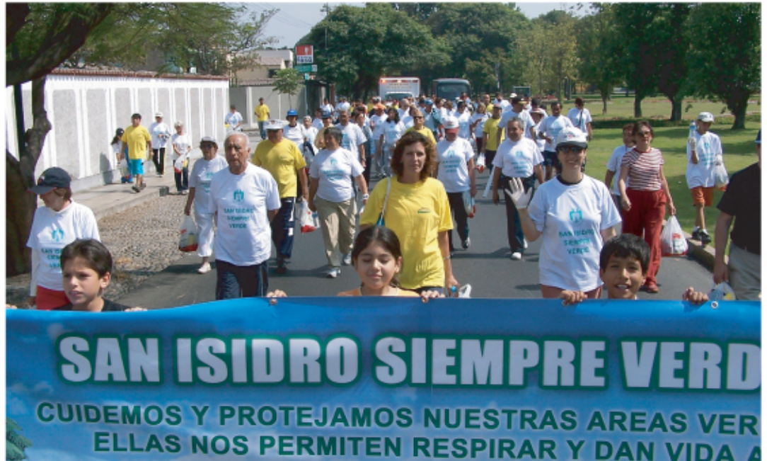
Niños, jóvenes y adultos, unidos por el medio ambiente.

Alrededor de 120 sanisidrininos se reunieron en la pileta de la Av. Pablo Carriquiry, desde donde iniciaron su recorrido hacia las avenidas Parque Sur, Gálvez Barrenechea y Parque Norte, acompañados de funcionarios y autoridades municipales. ■