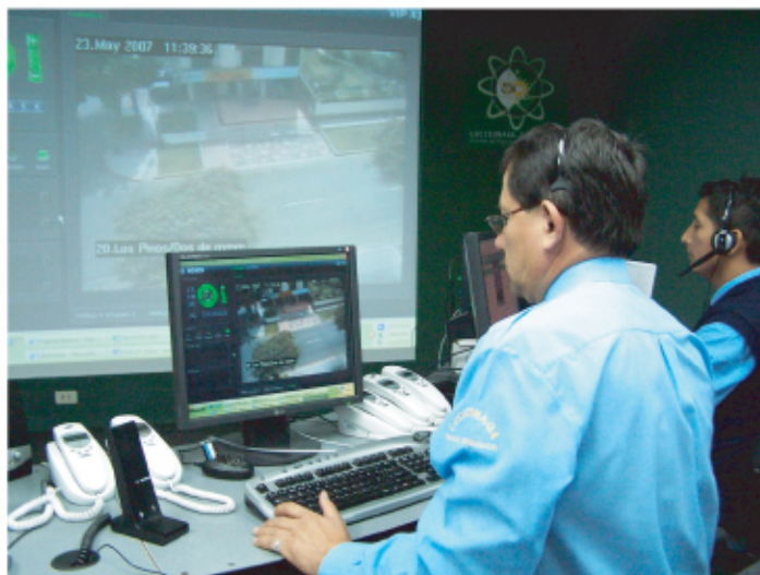
Ahora las cámaras de seguridad están integradas a la central de emergencias.

La integración de este sistema ha sido desarrollado completamente por la corporación edil; logrando de esta manera un ahorro económico significativo para la municipalidad, lo que permitirá invertir lo ahorrado en mejorar el servicio y la atención al vecino, en materia de Seguridad Ciudadana.