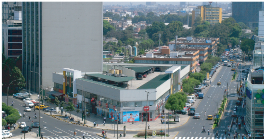
Se ha autorizado en las zonas comerciales 244 licencias de funcionamiento definitivas.

De otro lado, en cuanto al otorgamiento de licencias para anteproyectos fueron 32 para edificaciones