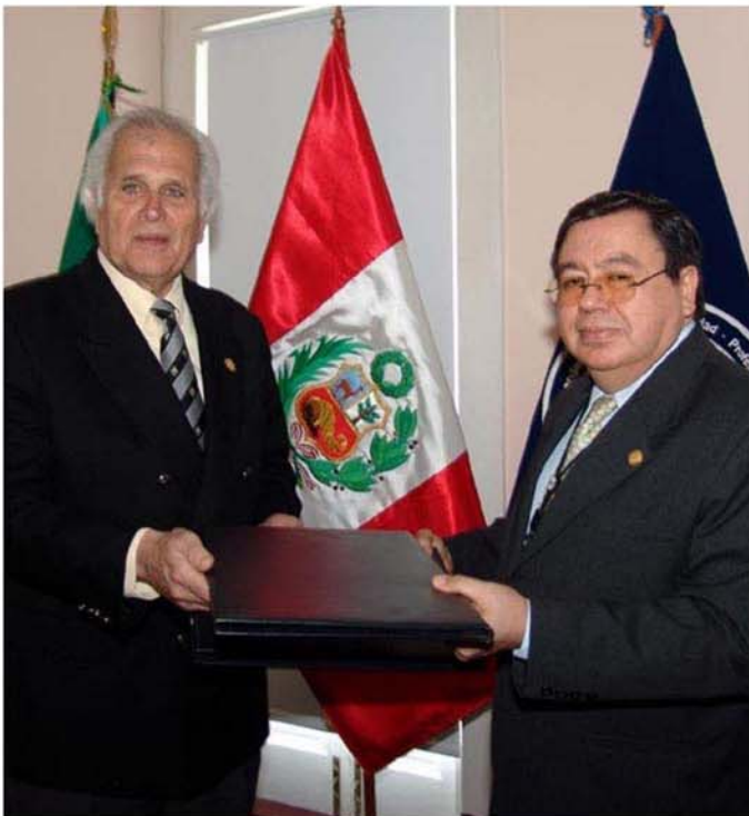
Alcalde Antonio Meier y Contralor General de la República, Genaro Matute.