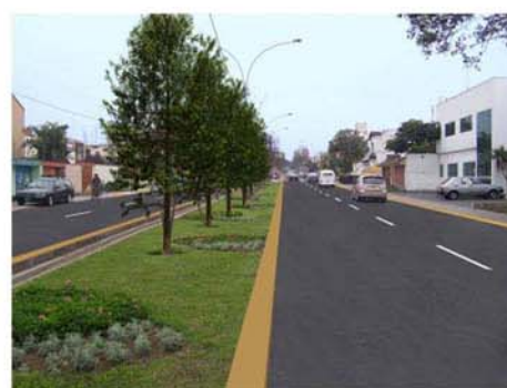
OBRAS Y PROYECTOS