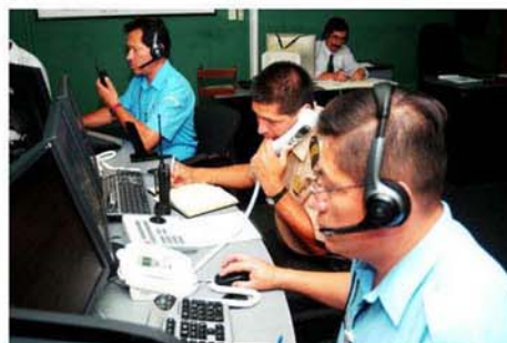
RENOVADO SISTEMA DE VIGILANCIA