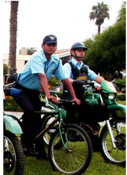
Veinte motos y 240 bicicletas, se integrarán para dar un mejor servicio de Seguridad Ciudadana.

■ ROBOS DE AUTOPARTES BICICLETAS Y MOTOS ■ ROBOS A TRANSEÚNTES ■ ROBOS A PREDIOS