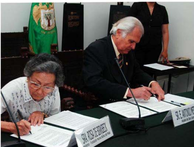
Burgomaestre de San Isidro con la señora Rosa de Birkbeck firmando el convenio.

Con este acuerdo San Isidro se convierte en el primer distrito en comprometerse a fortalecer su sistema de fiscalización y control interno, previniendo así todo tipo de irregularidades en sus procesos administrativos y en el comportamiento de sus funcionarios.