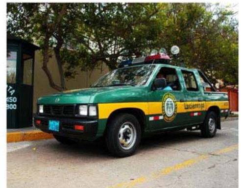
16 nuevas camionetas PICK UP, serán adquiridas para la vigilancia de las calles del distrito.