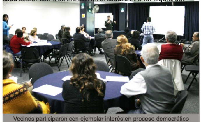
Vecinos participaron con ejemplar interés en proceso democrático

Al finalizar los talleres de trabajo, se eligieron a los miembros Titulares y Suplentes del Comité de Vigilancia y Control por cada sector como se indican en el cuadro inferior izquierdo.