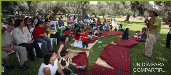
UN DÍA PARA COMPARTIR...

El 12 de diciembre se hará entrega de las mejores aceitunas de nuestra cosecha 2008 a los vecinos (personas naturales) del distrito. Se repartirán bolsas de 500 gr (una por contribuyente), con aceitunas de la mejor calidad a los vecinos que se acerquen con el DNI del distrito.