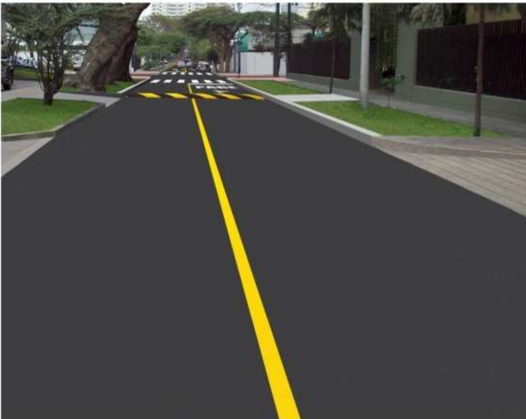
Rehabilitación y mejoramiento de la calle Los Alamos cuadras 3, 4, 5 (sector 1).