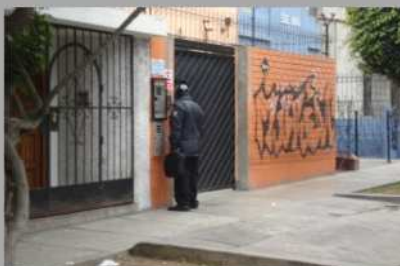
Empresa que funcionaba sin licencia municipal fue intervenida.