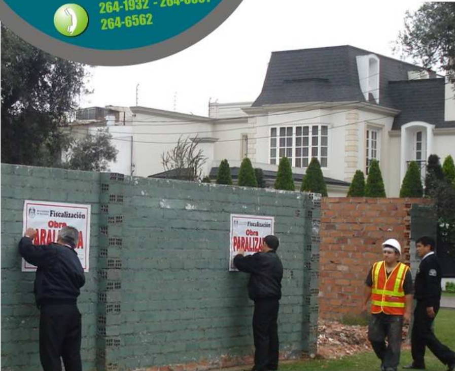
Se paralizan obras sin licencia para velar por el ornato y la seguridad.

La Gerencia de Fiscalización con la finalidad de garantizar el cumplimiento de la normatividad vigente continua implacable con la ejecución de clausuras a locales de funcionamiento clandestino, locales que incumplen las normas de seguridad y aquellos que varían las condiciones que motivaron el otorgamiento de su autorización, paralización de obras y construcciones antirreglamentarias. Garantizando de esta manera la tranquilidad de los vecinos y de los administrados que respetan la normatividad y la integridad de su personal.