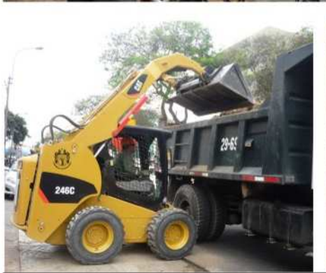
NUEVOS EQUIPOS PARA EL MANTENIMIENTO DE LAS VÍAS DEL DISTRITO