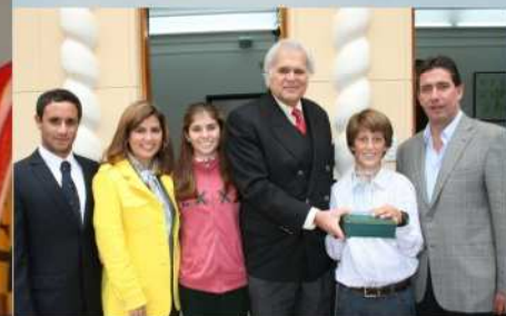
MSI distingue a niño campeón.