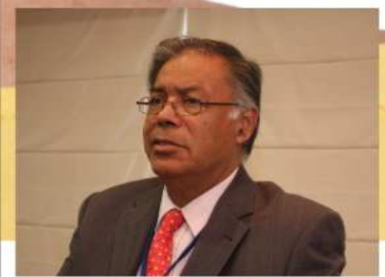
Especialista mexicano dio charlas en Lima.