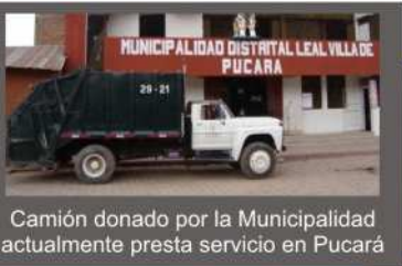
Camión donado por la Municipalidad actualmente presta servicio en Pucará