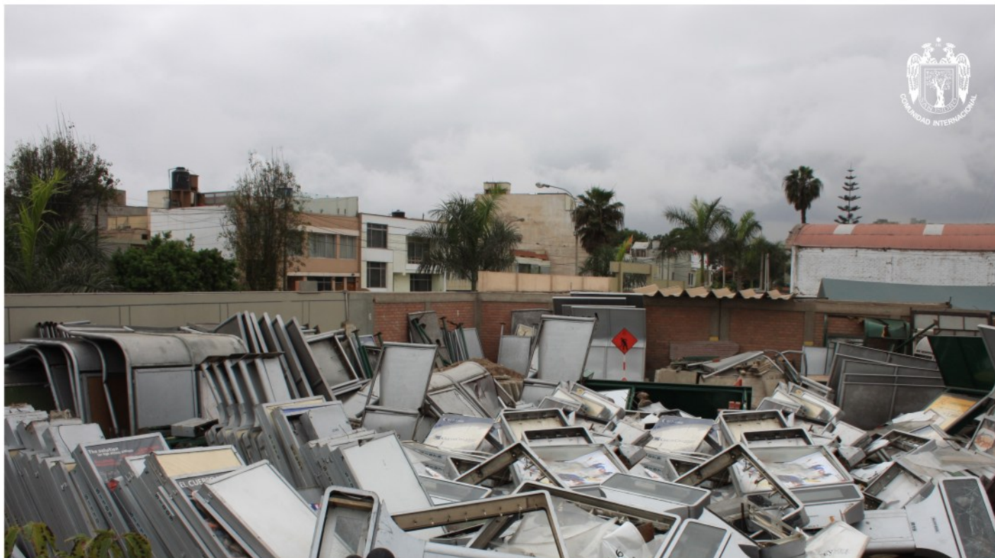
Mobiliario urbano instalado sin autorización en el distrito, fue retirado por la Municipalidad de San Isidro.