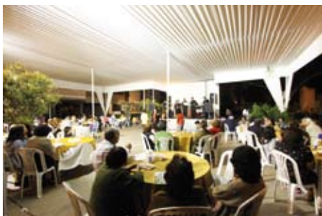
Anticuchada en la Residencial Santa Cruz