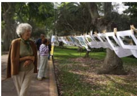
Exposición y concurso de fotografía al aire libre