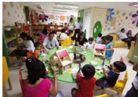
Taller dirigido a padres de familia