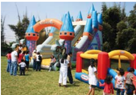
Día de la Familia Sanisidrina