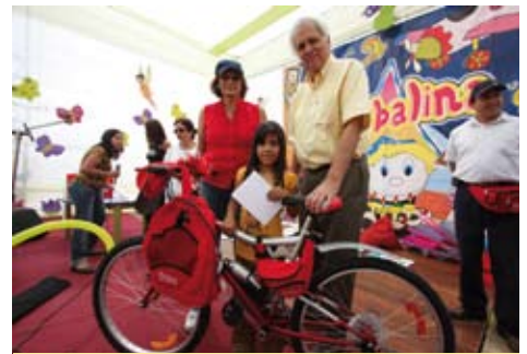
Día de la Familia Sanisidrina