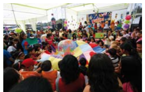
Día de la Familia Sanisidrina