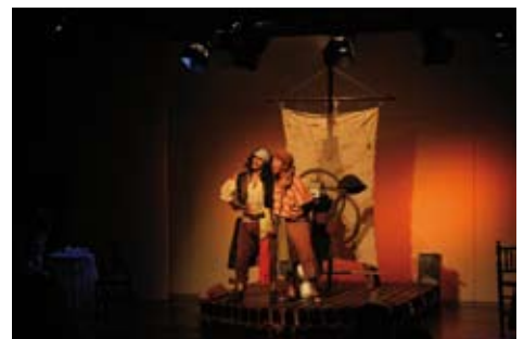
“Las Tremendas Aventuras de la Capitana Gazpacho”