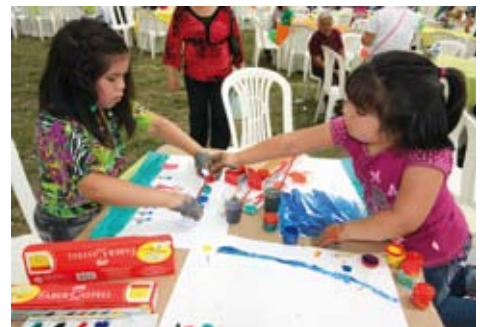
Día de la Familia Sanisidrina