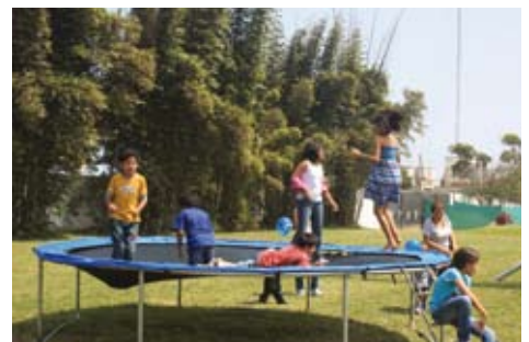
Día de la Familia Sanisidrina