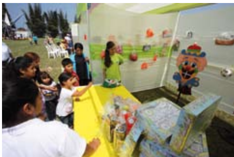
Día de la Familia Sanisidrina