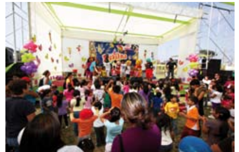
Día de la Familia Sanisidrina