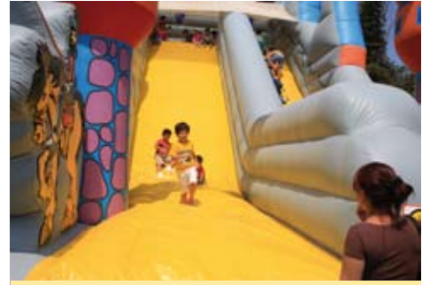
Día de la Familia Sanisidrina