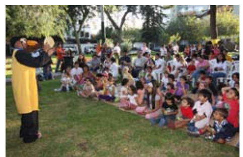
Teatro y Cuentos en el Parque