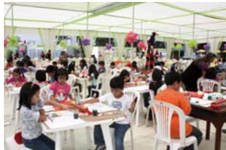
Día de la Familia Sanisidrina