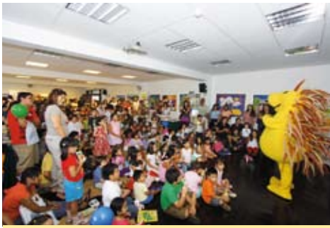
Feria del Libro Infantil y Juvenil