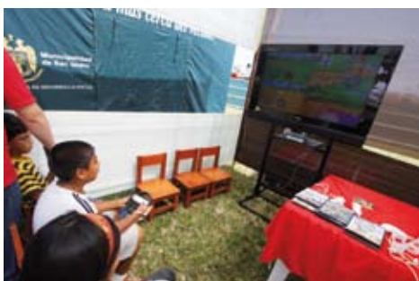
Día de la Familia Sanisidrina

El 24 de abril cumplimos 79 años y lo celebramos junto a ustedes. Fue una fecha muy especial por lo que preparamos un nutrido programa de actividades que se inició el sábado 10 de abril, con la presentación de la Feria del Libro Infantil y Juvenil, que se realizó con gran éxito en la Sala Multiusos del Centro Cultural El Olivar. También con gran entusiasmo y la participación de numerosos vecinos, se efectuaron las tardes de Teatro y Cuenta Cuentos en diversos parques del Distrito. Asimismo, en la Biblioteca Infantil se desarrollaron 4 talleres dirigidos a padres de familia y sus hijos, quienes de una manera alegre y divertida conocieron más sobre técnicas y estrategias de lectura.