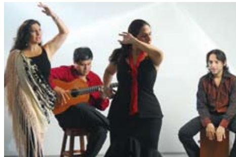
Espectáculo de baile flamenco - Gitanerías