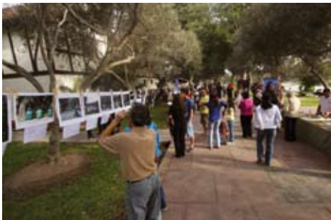
Exposición y concurso de fotografía al aire libre