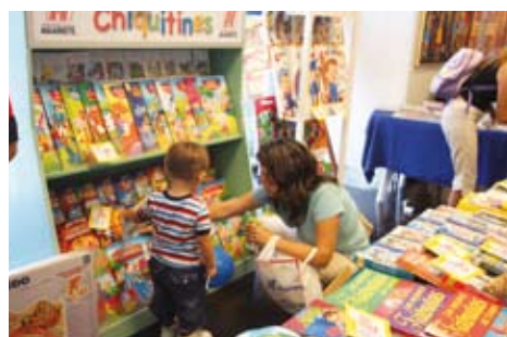
Feria del Libro Infantil y Juvenil