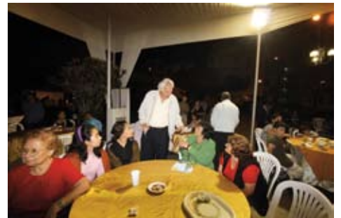
Anticuchada en la Residencial Santa Cruz