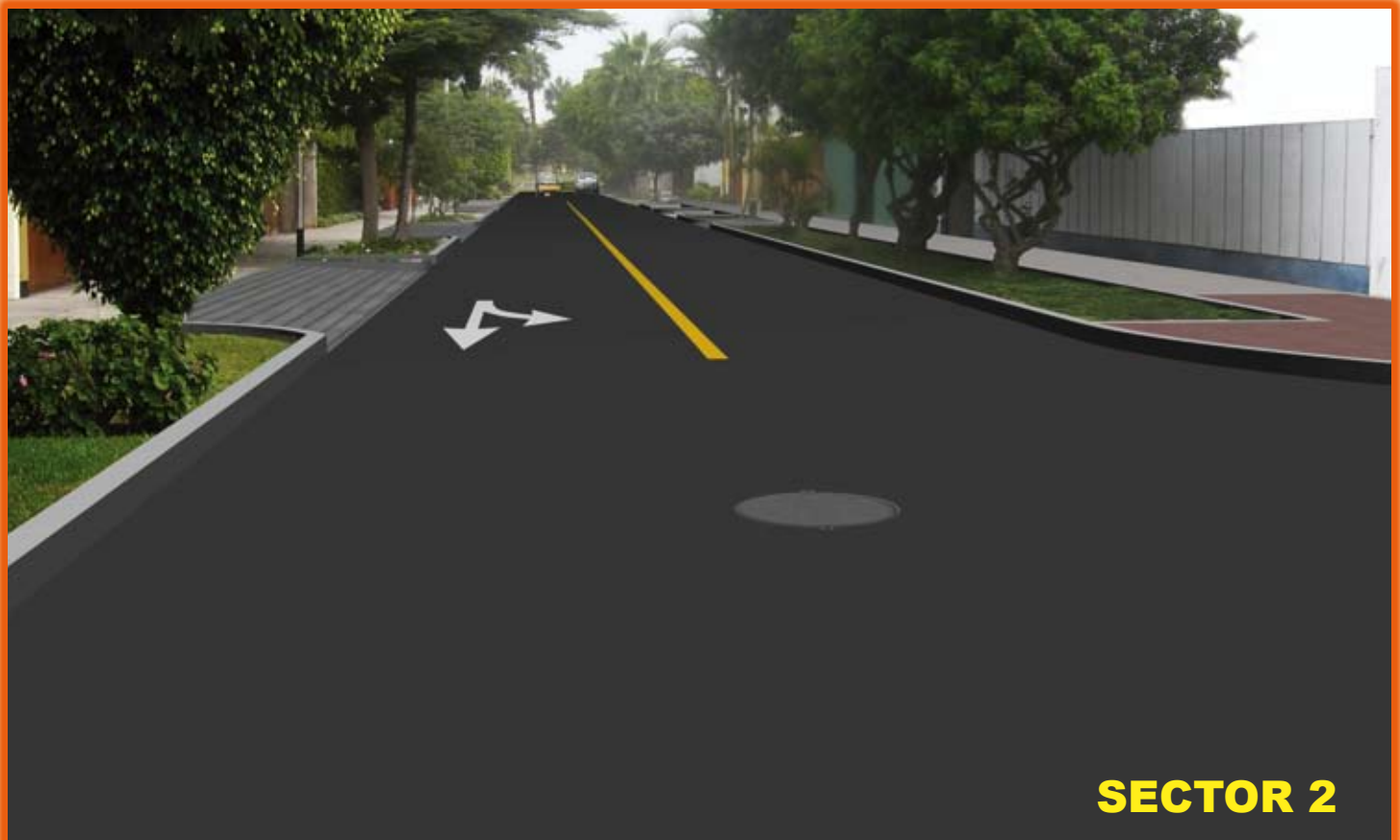
Mejoramiento de la Ca. Punta Negra, de las cuadras 1 a la 4.