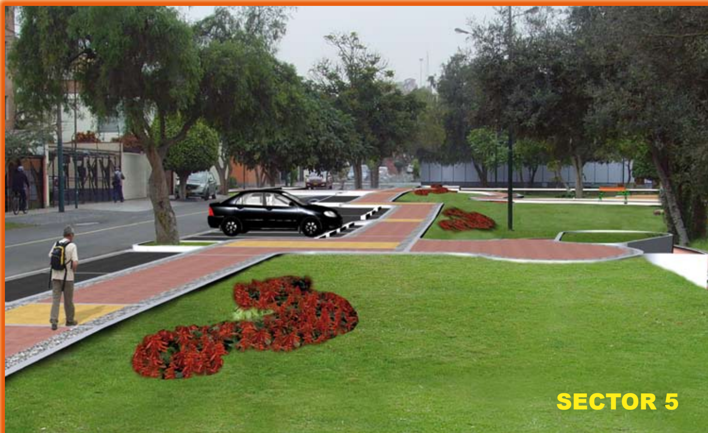
Mejoramiento del Parque de la Dignidad.