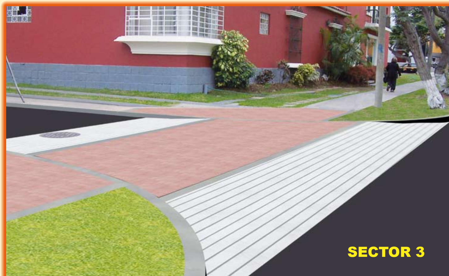
Mejoramiento de la zona urbana comprendida entre Ca. Carolina Vargas, Av. Santa Cruz, Av. Felipe Pardo y Aliaga y Ca. La República.