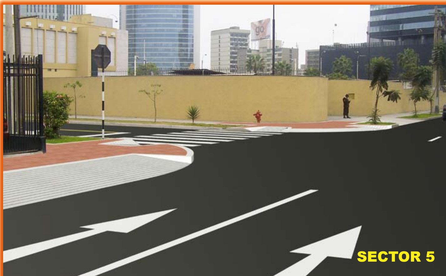
Calle Los Ruisñores Este y Oeste y calle Las Tordillas.