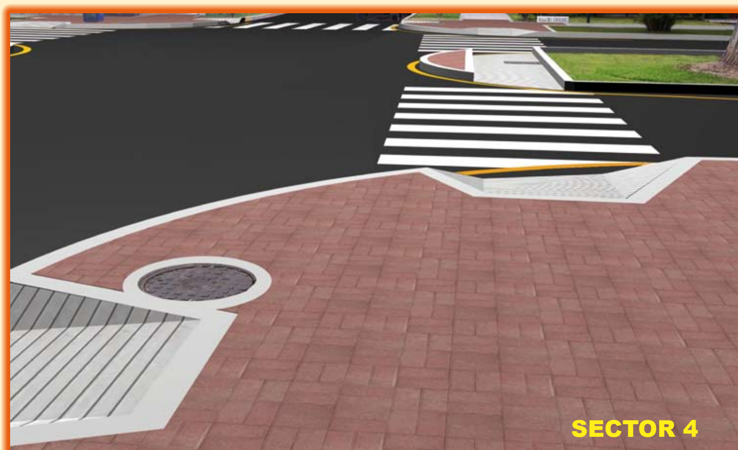
Mejoramiento de la zona urbana comprendida entre la Av. Enrique Canaval y Moreyra, Parque José L. Bustamante y Rivero, Av. Andrés Aramburú y Av. Paseo de la República