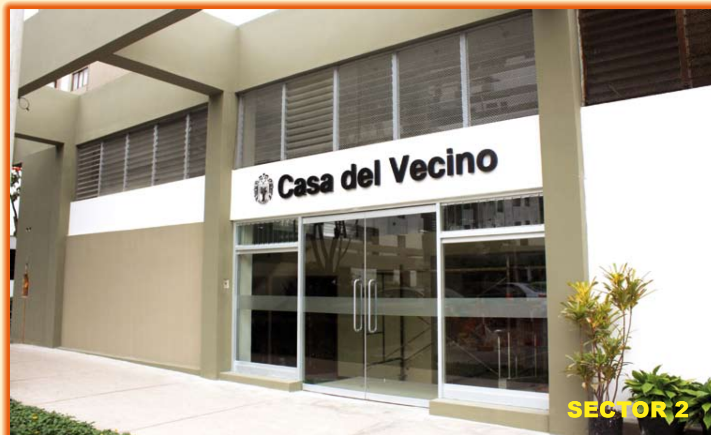
Casa del Vecino en la Residencial Santa Cruz.