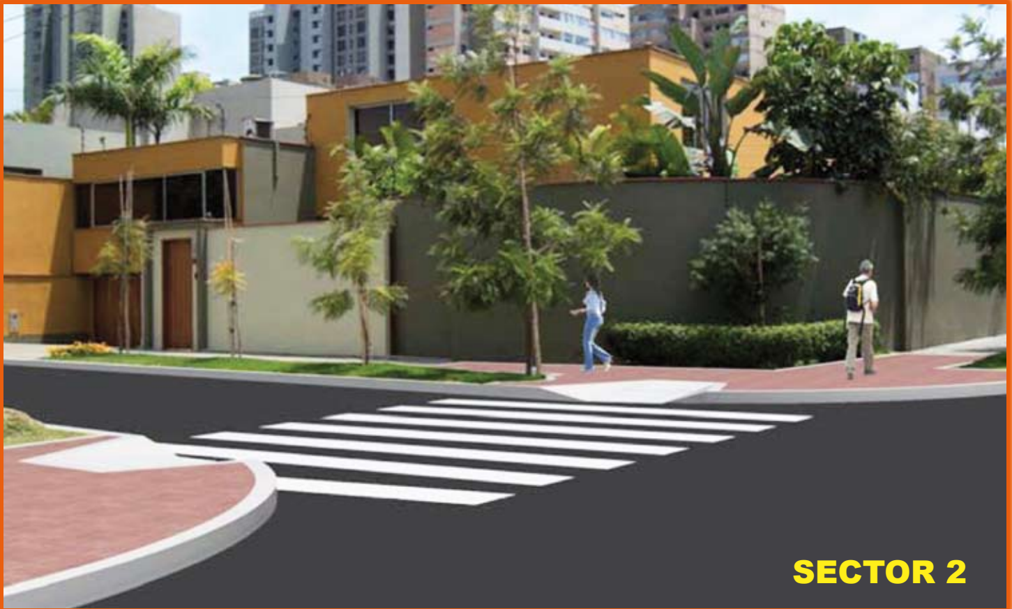
Mejoramiento de la Ca. Augusto Bolognesi de las Cuadras 0 a la 3