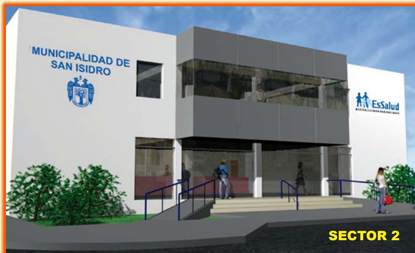
Construcción de la Unidad Básica de Atención Primaria de Salud (ESSALUD)