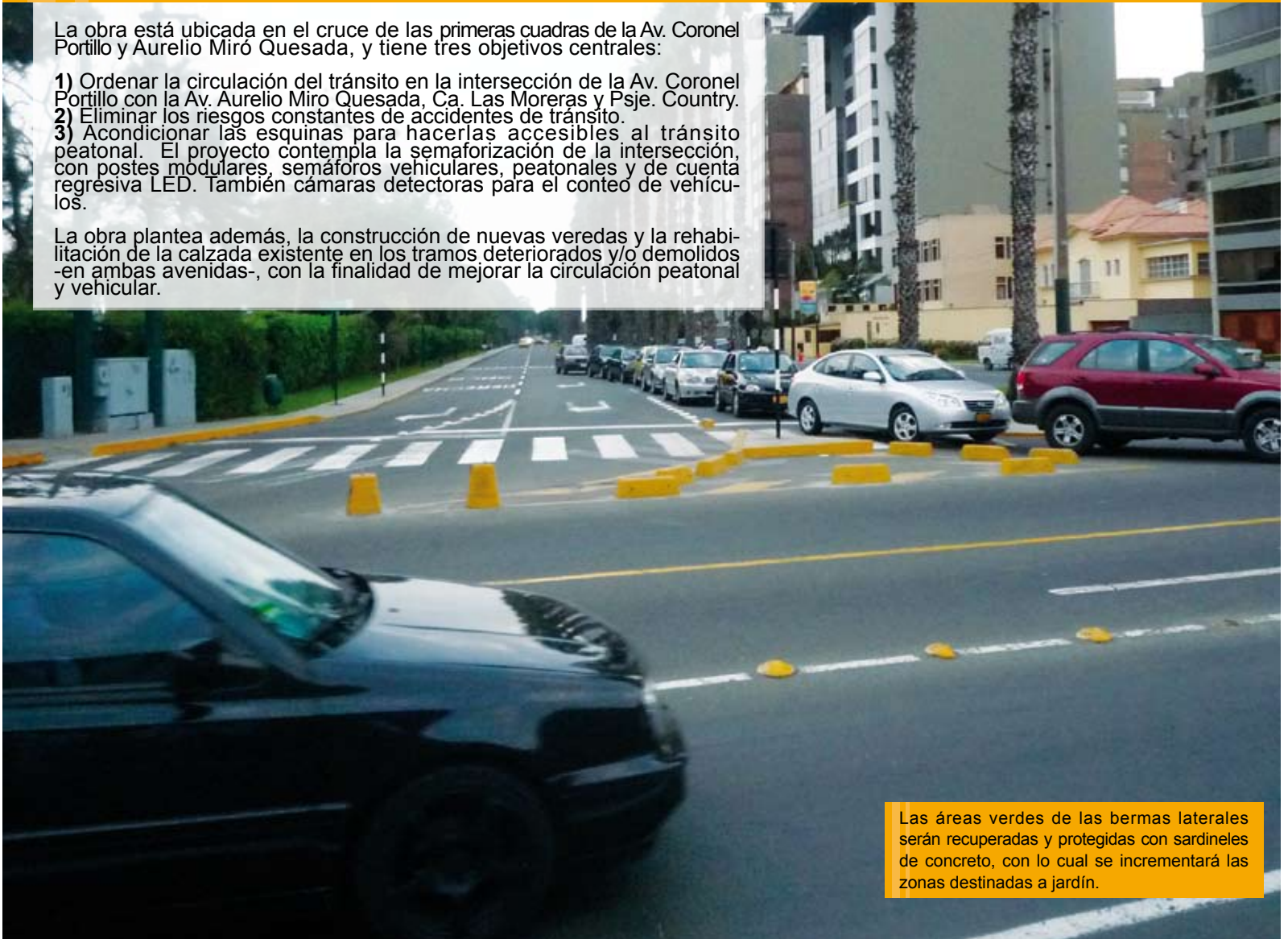
Las áreas verdes de las bermas laterales serán recuperadas y protegidas con sardineles de concreto, con lo cual se incrementará las zonas destinadas a jardín.

La obra plantea además, la construcción de nuevas veredas y la rehabilitación de la calzada existente en los tramos deteriorados y/o demolidos -en ambas avenidas-, con la finalidad de mejorar la circulación peatonal y vehicular.